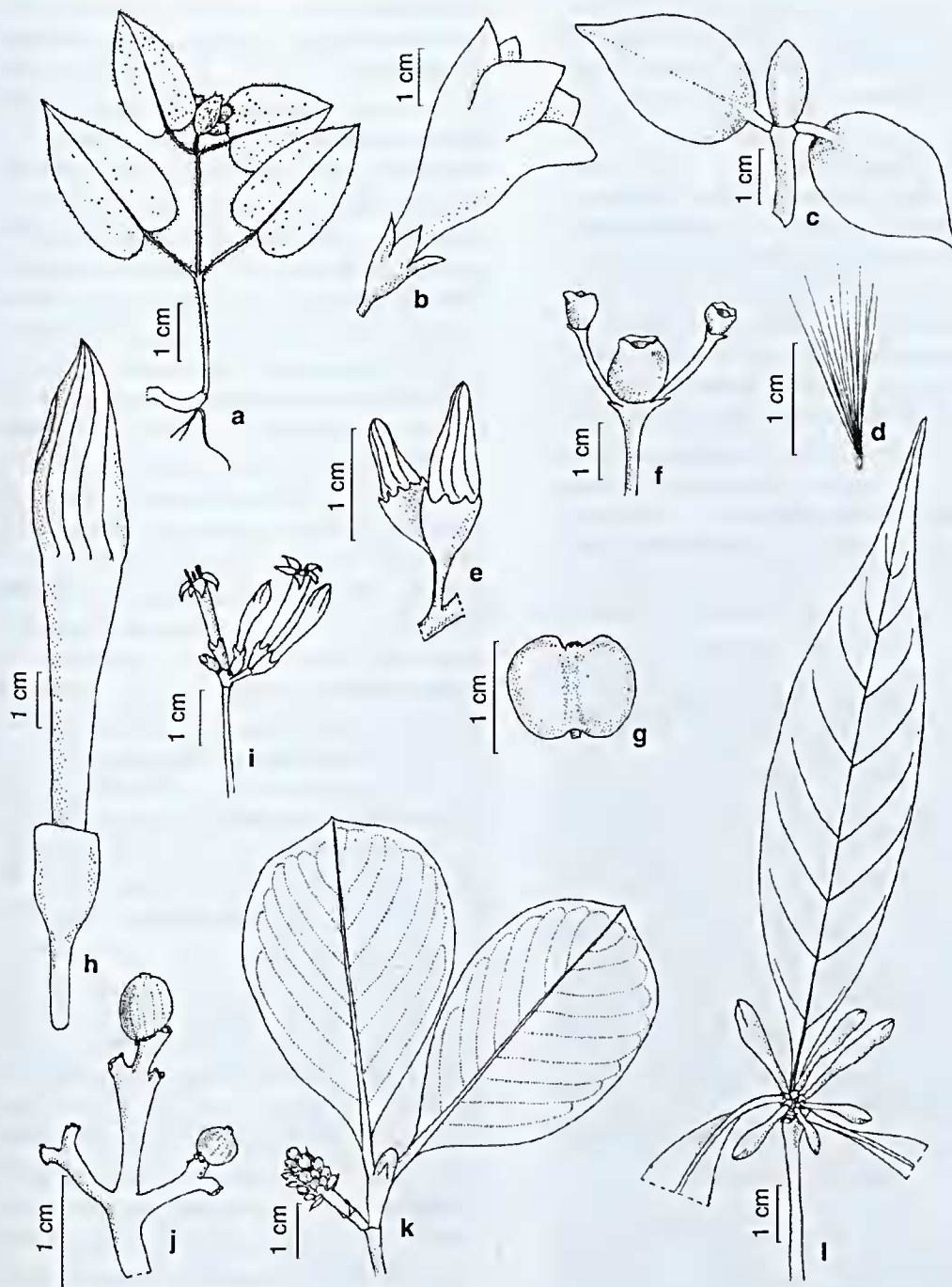
Figura 2 – a. Geophila cordifolia , planta em fruto (Costa 35); b. Henriquezia verticillata , vista lateral da flor zigomorfa (Vicentini 370); c-d. Hillia ulei , c. ápice do ramo com estípula, d. Semente comosa (Egler 46683); e. Ibetralia surinamensis , detalhe da inflorescência (Ducke 22916); f. Isertia hypoleuca , detalhe da infrutescência (Campos 531); g. Ixora ulei , fruto (Ferreira 118); h. Kutclubaea sericantha , botão floral (Ribeiro 1831); i. Ladenbergia amazonensis , detalhe da inflorescência (Cordeiro 1554); j. Margaritopsis boliviana , detalhe da infrutescência (Campos 526); k. Malanea sarmentosa , parte apical do ramo com inflorescência (Ackerly 117); l. Morinda triphylla , parte apical do ramo com inflorescência (Ducke 23210).